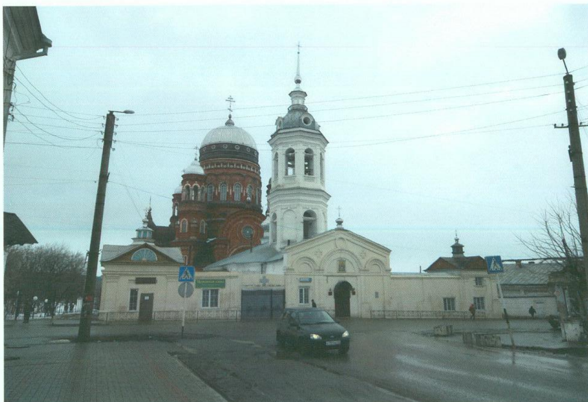
Фото 1. «Троицкий собор», г. Уржум, ул. Советская, д. 34. Дата – 16.10.2015.

объекта культурного наследия (памятника истории и культуры) народов Российской Федерации