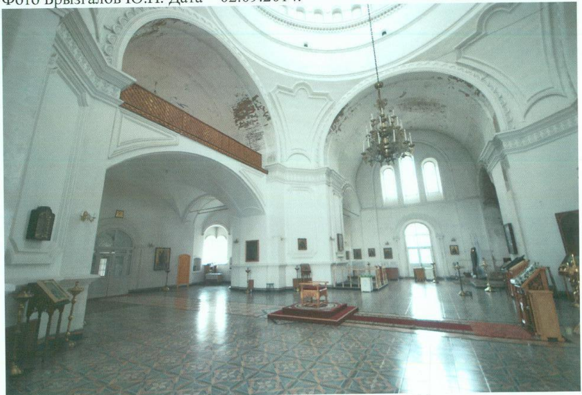
Фото 5. «Троицкий собор», г. Уржум, ул. Советская, д. 34. Дата – 02.09.2014.