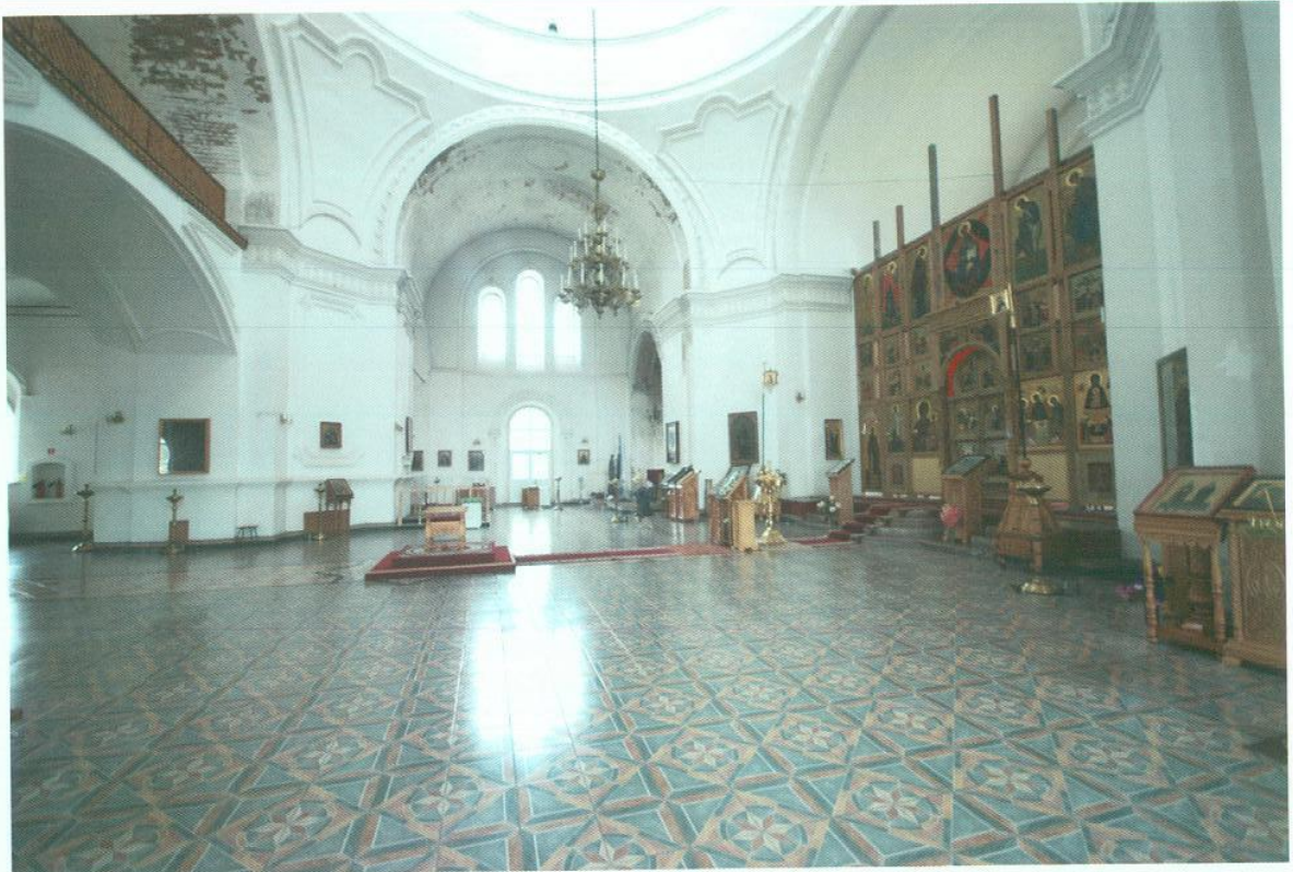
Фото 4. «Троицкий собор», г. Уржум, ул. Советская, д. 34. Дата – 02.09.2014.