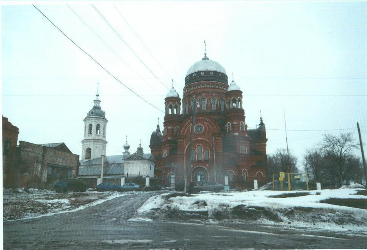
Фото 2. «Троицкий собор», г. Уржум, ул. Советская, д. 34. Дата – 16.10.2015.