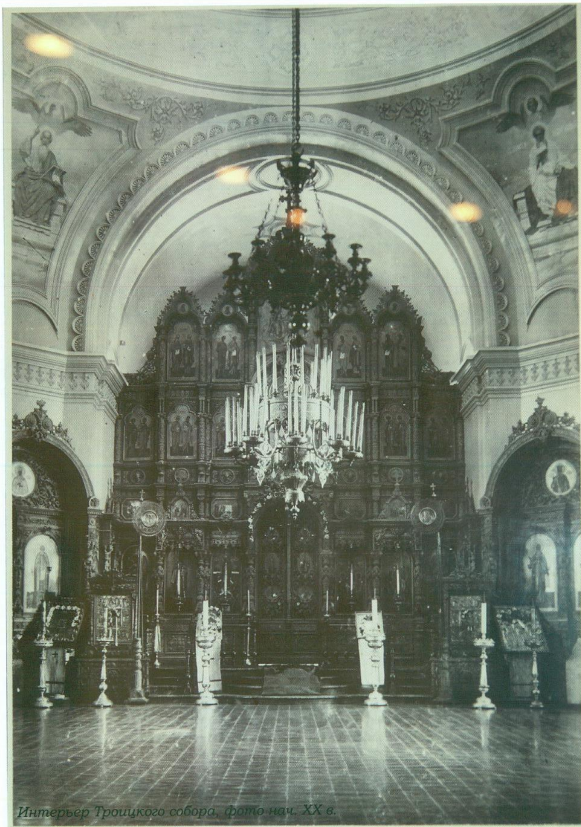
Интерьер Троицкого собора, фото нач. XX в.